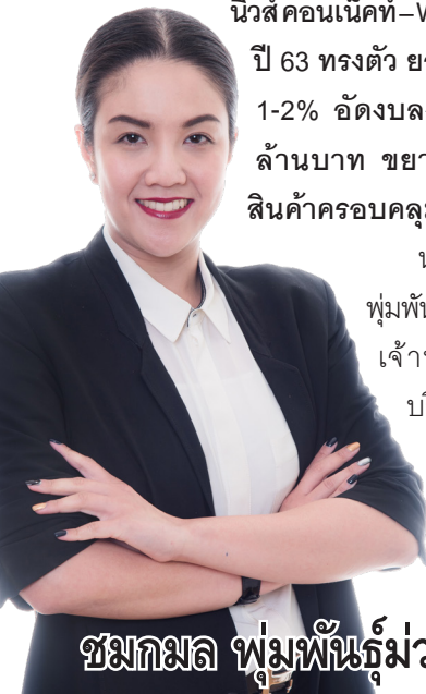
ชมกมล พุ่มพันธุ์ม่วง

อย่างไรก็ตาม ต้องติดตามปัจจัยเสี่ยงของเสถียรภาพราคา LPG ในประเทศ ซึ่งปัจจุบันภาครัฐยังคงตรึงราคา โดยมีกองทุนน้ำมันเชื้อเพลิงมาช่วยเหลือนำเข้าเพื่อให้เกิดเสถียรภาพทางด้านราคา และอีกปัจจัยคือ เศรษฐกิจของประเทศเนื่องจากมีผลต่อการบริโภคโดยตรง เนื่องจาก LPG จำเป็นต้องใช้ในชีวิตประจำวัน ส่วนค่าเงินบาทยังไม่มีผลกระทบต่อบริษัท เนื่องจากรายได้หลักเกือบ 100% อยู่ในประเทศ.